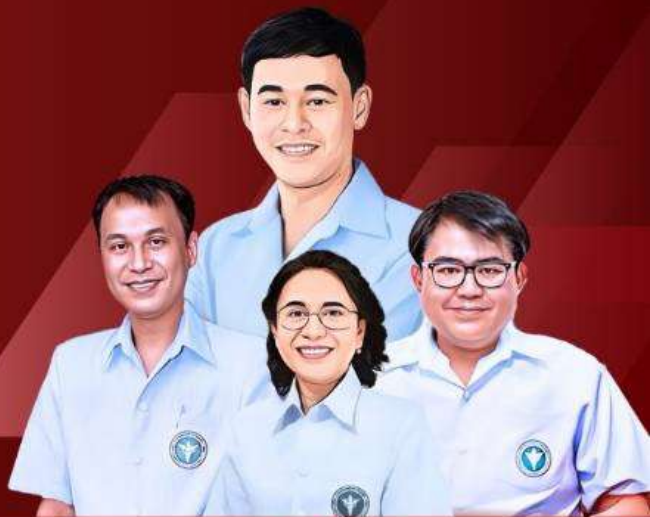
คณะผู้บริหาร สำนักงานสาธารณสุขจังหวัดสุราษฎร์ธานี